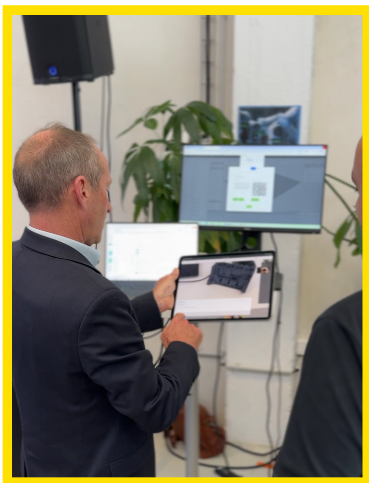
Stand PTC, tablette connectée pour le contrôle qualité produit.

Les tablettes connectées ont permis une immersion intuitive, facilitant l'accès à des informations en temps réel et enrichissant l'expérience utilisateur.