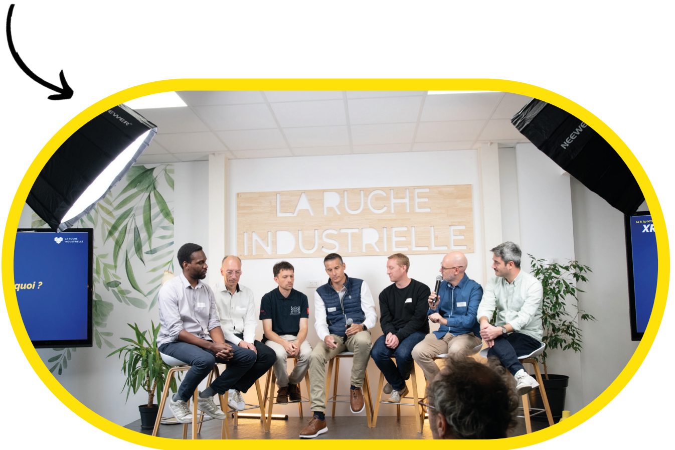
Table ronde : Open USD

Les échanges ont mis en lumière des retours d'expérience concrets, des approches complémentaires et une vision commune : celle d'une interopérabilité accrue et d'une collaboration fluide entre les mondes virtuel et réel — un enjeu majeur pour l'industrie du futur.