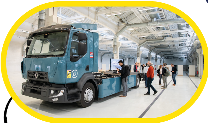
Diagnostic faisceaux Camion Volvo grandeur nature