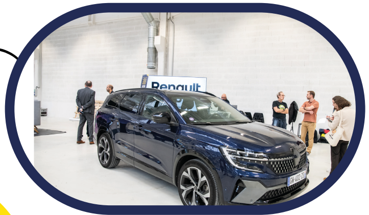
Démonstration « voir les sons »