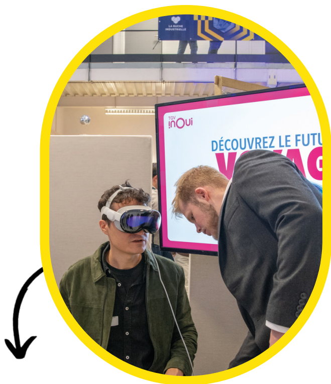
Démonstration Apple vision pro - SNCF